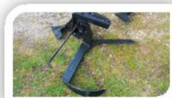
Reja giratoria brazo