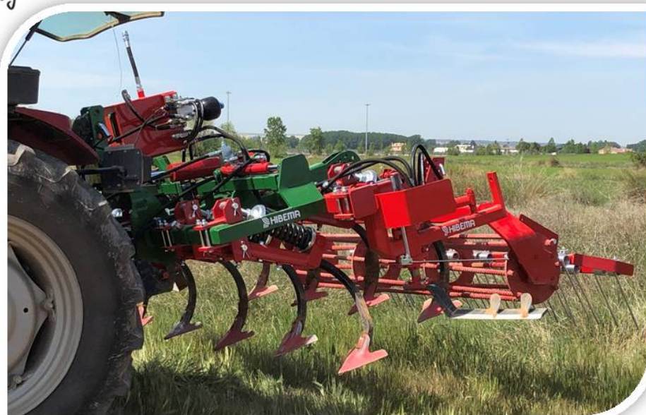
Intercepa integral, 2 brazos, centralita con circuito autonomo, mando electro-hidráulico

Adaptable a cualquier cultivador Ideal para viñas en vaso y espaldera de mas de 3 años Regulación de altura Cilindro para recogida cuchilla Regulación de presión del muelle