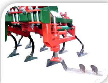
Intercepa de muelle con recogida hidráulica