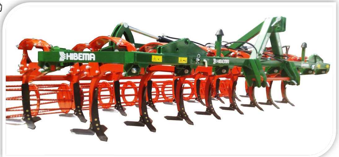
CBF-17 Rodillo 500 mm