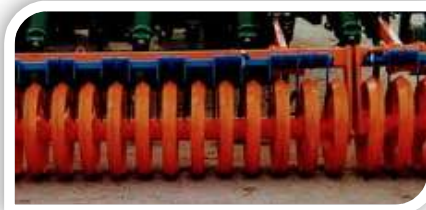
Detalle rodillo de aros con rastrilla