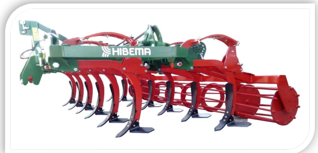
CBF-13 P Rodillo barras