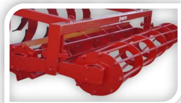
Doble rodillo pletinas-redondo

Pareja de ruedas neumática Suplemento ballesta 5 hojas (Por brazo)