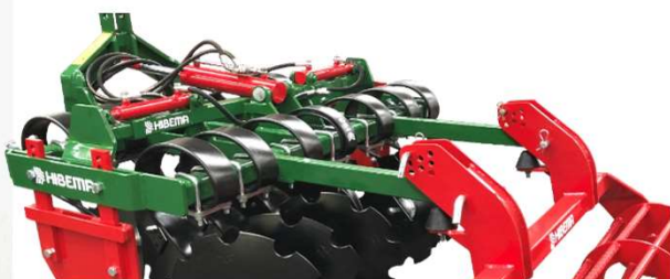
Detalle torreta plegable y extensible hidráulico