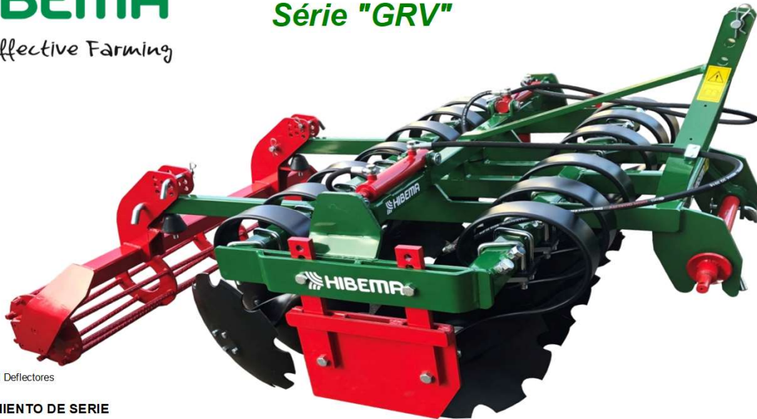
GR-12 VF EH Deflectores