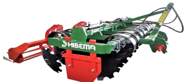
GR-16 VF EH Rodillo