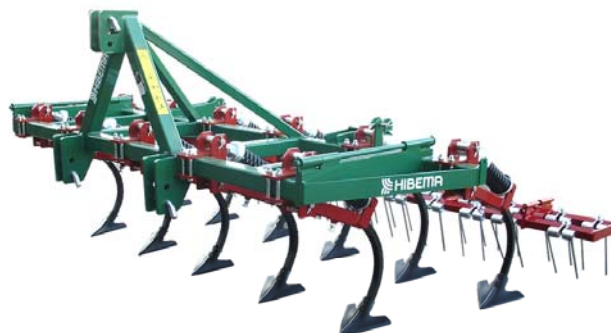
CM-11 L Rastra