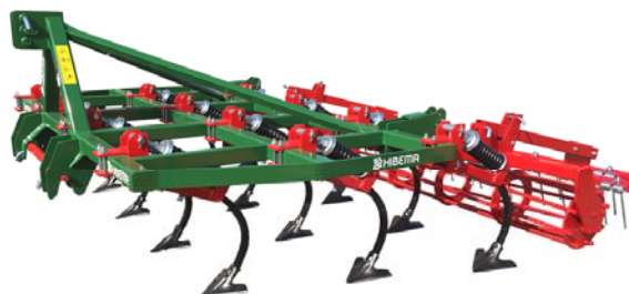
CM-13 LH 3F Rodillo y Rastra