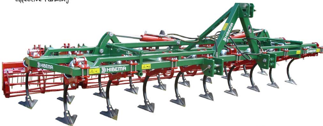
CM-19 LH Rod. Y Rastra