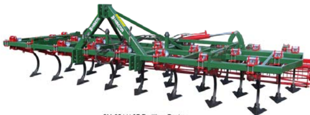
CM-25 LH 3F Rodillo y Rastra