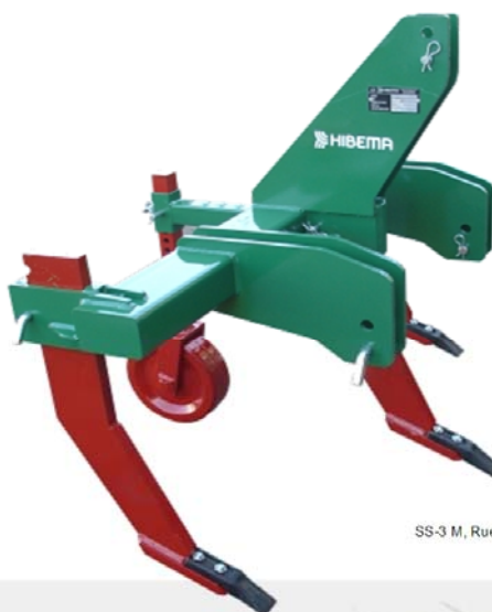
SS-3 M, Rueda control