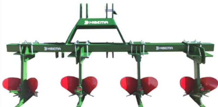
AS-4 R Doble torreta