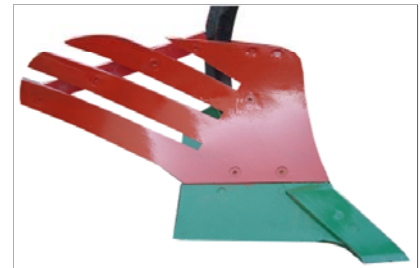
Teja de láminas