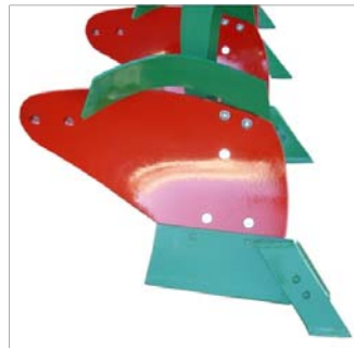
Teja estándar, cubre-pajas, colas y cuchillas