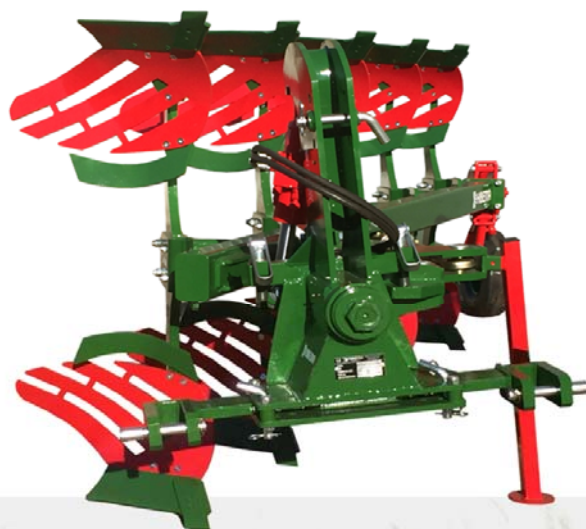
AV-5 TL Cubrerastros

Chasis ampliable (Módulo atomillado) Rueda combinada control-transporte (Suplemento) Tejas de láminas (Suplem. por cuerpo) Cubre rastros (Pareja) Colas (Pareja)