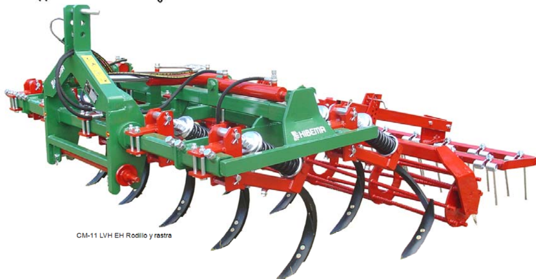
CM-11 LVH EH Rodillo y rastra