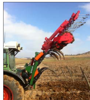
Detalle torreta plegado hidráulico

* Los anchos de labor son los estandares, pueden ser modificados.