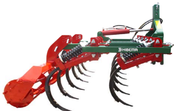
CM-9 LVH Rodillo

* Los anchos de labor son los estandares, pueden ser modificados.