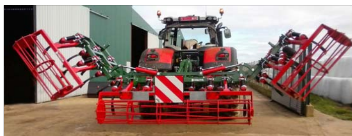
Detalle plegado 4 cilindros