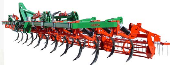
CM-21 SH Rod y Rastra (Plegado 4 cilindros)