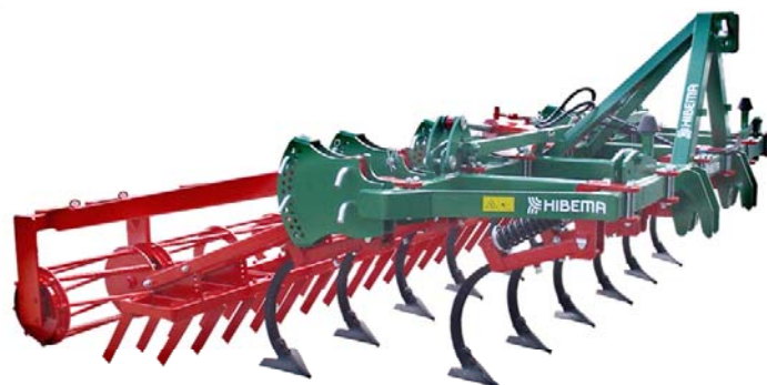
CM-13 SH Rastra cuchillas, Rodillo

Rodillos 400 ó 500 mm Rastras doble fila muelles o cuchillas Plegado manual o hidráulico Ruedas de control Reja cavadora o golondrina