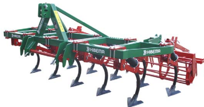
CM-11 S Rodillo + Rastra cuchillas